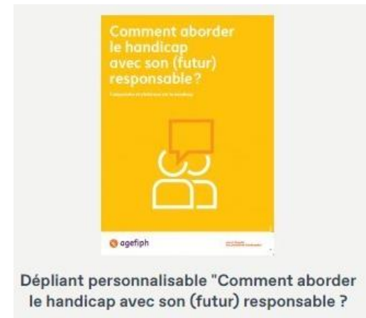
Dépliant personnalisable "Comment aborder le handicap avec son (futur) responsable ?